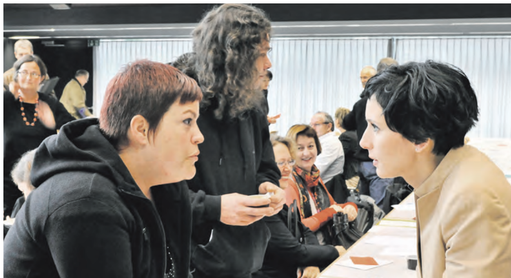
SP FRAUEN AARGAU